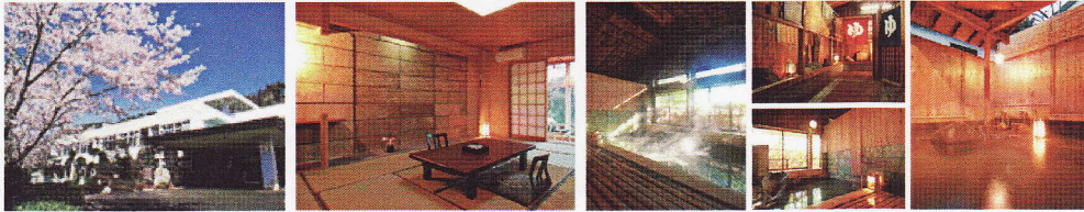
静寂に心やすらぐ寛ぎの空間

【ご宿泊先】 伊豆修善寺温泉 野の館「ホテル和光」 ★2名様1室ご利用 (お1人部屋の場合は、追加料金3,150円)