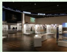
ウボポイ (民族共生象徴空間)