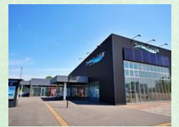
道の駅 サーモンパーク千歳