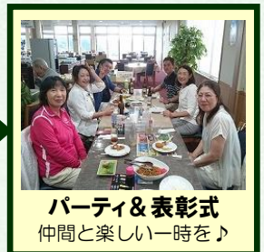
パーティ&表彰式 仲間と楽しい一時を♪