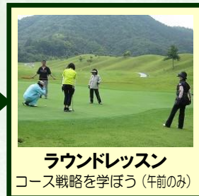
ラウンドレッスン コース戦略を学ぼう(午前的み)