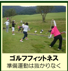
ゴルフフィットネス 準備運動は抜きなく