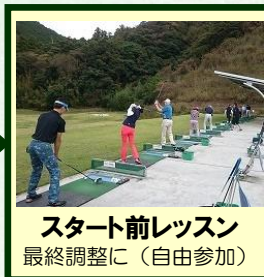
スタート前レッスン 最終調整に(自由参加)